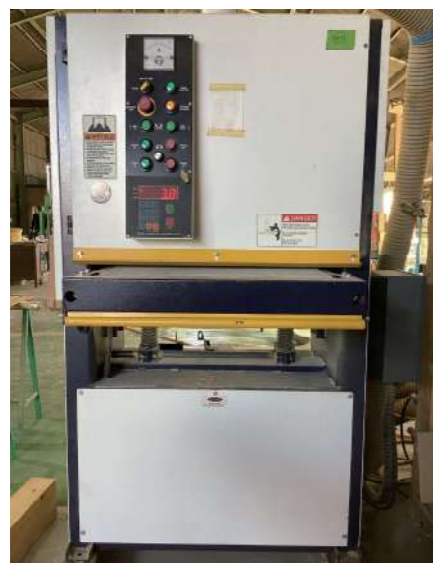
ワイドベルトサンダー