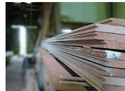
フローリング加工