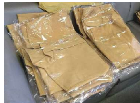
耐熱上着・ズボン