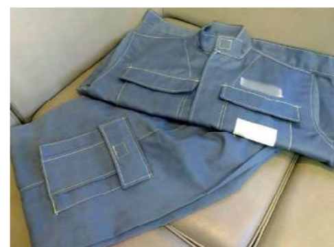
耐熱上着・ズボン